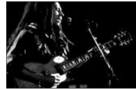
Боб Марли исполняет песню «Buffalo Soldier», посвященную одному из первых чернокожих землемеров в Америке.

Боб Марли, всем нам хорошо известный как потрясающий вокалист и композитор, в начале становления своей творческой карьеры перепробовал множество самых разных профессий. Судьба распорядилась так, что легендарному исполнителю регги представилась возможность попробовать себя в роли речечника на Ямайке.